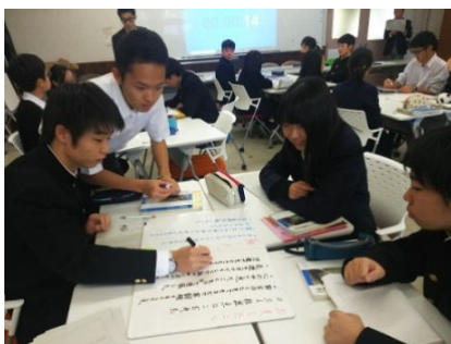
図表 1 11/29 国語の研究授業