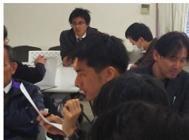
図表2 11/29 研修の様子